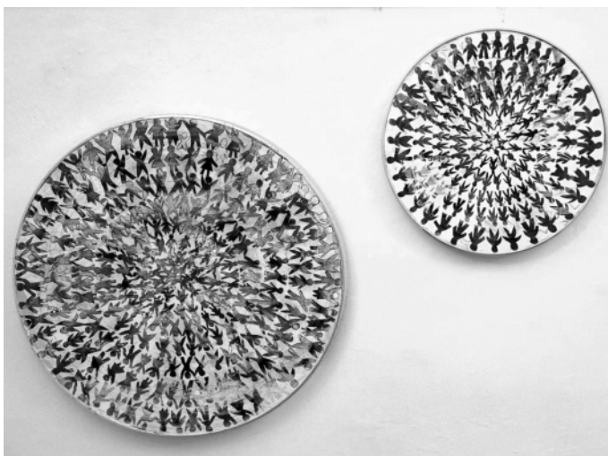
„Rundarum! Mensch“ u. „Oh, Mensch“

Eigentümer, Herausgeber und Verleger: „Absolventen und Freunde des Fürstenfelder Gymnasiums“, Realschulstraße 6, 8280 Fürstenfeld. Im Sinne des Pressegesetzes verantwortlich: OStR Mag. Joachim Friessnig, Hamerlingstr. 13, 8280 Fürstenfeld. Druck: Schmidbauer, 8280 Fürstenfeld, Wallstraße 24